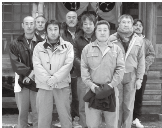
会社の社員と（前列右側）

に感じた事が脳裏に残っております。母校である種市高校があるこの洋野町は、長い潜水教育の歴史があります。今後も日本の潜水教育の先頭に立って、押し進めていくにふさわしい土地柄ではないかと感じています。 私も一年に一度種市高校へ行き、海洋開発科在學生に對して微力では有りますが、水中溶接及び水中切断の基礎を指導させて頂いております。 これからの潜水業界を担う後輩に期待しております。海洋開発科におかれましては、今後とも若手潜水技術者の輩出に力を注いで頂きたいと思っております。