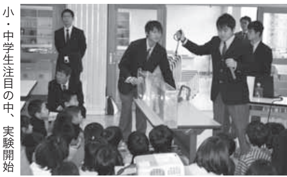
小・中学生注目の中、実験開始

高校生が実施するという初の試みとなった。授業の対象は種市中学校1年生であり、中学生に分かり易く体験しながら教えることをモットーとし、授業の構成を考えた。授業の構成や実験で使う津波解析モデルを生徒達が主体的に考え、津波発生装置は実習で使用しているポンベを使用し製作した。実際の授業では教員の予想を超え、中学生とコミュニケーションの危険性を実験を通して、しっかり伝えることが出来ていた。出前授業に関わった3年生は、教える難しさや、楽しさを肌で感じたようである。