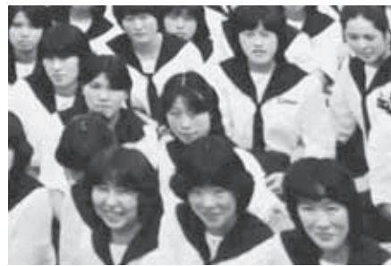
当時の喜代さん（写真中央）

「お魚を食べて、サメを塗るのが一番」 というお客様は、不思議な顔をします。 「化粧品やなのにサメって何」 でもいいのです。美容法も南部流。 ふるさとの訛なつかし物産展へ 今は、種市の魚が一番恋しいのです。