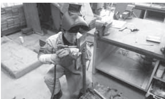
半自動溶接に挑戦する原子内君

しかし、立向溶接や、もう一つの課題の横向溶接で使う溶接棒が下向溶接で使っていた物とくらべて使いにくく、上手くなる兆しが見えませんでした。いろいろな先生に教えてもらいだんだん出来るようになってみると、次は、もっと上手くなりたいと思うようになり、楽しくなってきました。本番では、緊張していたせいか自己ベストは出ませんでした。その後、最優秀賞を受賞したことを聞いたときは信じられなかったし、とてもうれしかったです。