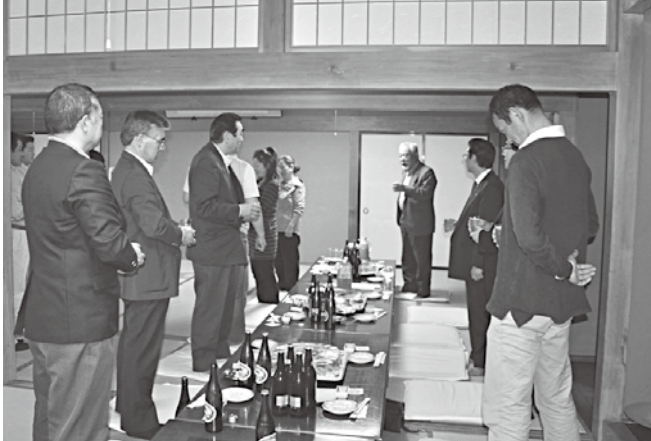
総会の様子 (なかの食堂にて)

《東京支部総会》 《八戸支部総会》 日時 平成26年6月14日(土) 日時 平成26年7月5日(土) 会場 「未定」 会場 「未定」