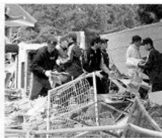
生徒によるボランティア片付け作業

はできませんでした。しかし、この震災により大きな被害を受けている地域もある中で、種市高校では、種市港にあった船具庫が流されたほかには大きな被害はなく、実習船種市丸も乗組員の皆さんの素早い対応で、津波が到達する前に沖に避難することができました。電話がなかなか通じず、生徒・職員の安否確認に時間はかかりましたが、生徒の家族が久慈で1軒大規模半壊、久慈と宮古で3軒床上浸水したほか、岩手県沿岸部宮古以南出身の職員の家族・親戚等に被害があったようですが、全員無事の確認ができました。