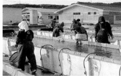
被害を受けた栽培センターも少しずつ作業を再開している

したが無事復旧し、平成24年3月から震災以前のダイヤで運行されます。 平成23年の漢字は「絆」。大災害ではありませんが、