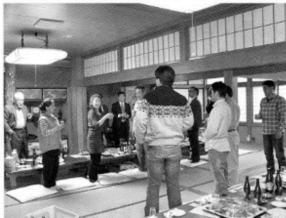
昨年の総会の様子 (なかの食堂にて)

日時 平成24年6月16日(出) 日時 平成24年7月7日(出) 会場 「未定」 会場 「未定」