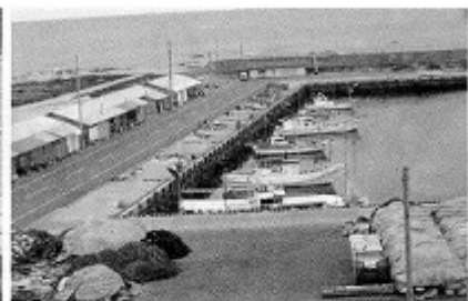
津波襲来前の種市漁港