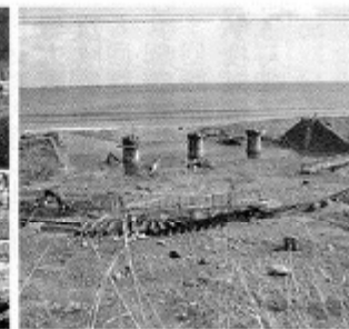
流された宿戸地区大浜の鉄橋