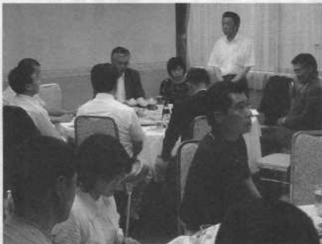
久慈支部総会の様子