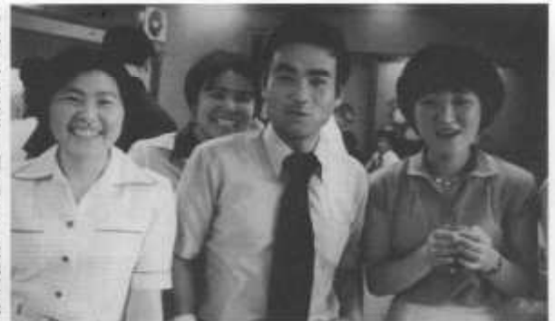
S49年、東京での同窓会で

落ち着きと自信に満ちている。思えば、当時私は21歳。大学に在学しながら国語の非常勤講師として、種市高校に赴任した。雨天順延となった運動会での場違いな新任教員。はじめに聴く校歌。はちきれんばかりの若さにあふれた全校生徒を前にして、脚が震えた。私の教員生活のスタートであった。 初任教、種高での8年あまりの思い出は尽きない。当時は久慈高校から独立したばかりで、生徒・教職員一丸となって校風作りに励んでいた。部活動では県北の覇者たるべく、「県大会出場」が言葉であった。また、行事にも積極的に取り組み、生徒の学校生活も活気に満ちていた。クラス対抗カルタ会・初めての芸術鑑賞会(演劇「かげの若」・「なにやどやら」を皆で踊った運動会・ひたすら歩いた階上岳全校登山・全クラブ地区予選通過の高校総体・学校でのクラブ合宿・今日の古典の授業は芝生で行います。教科書を持って集合」