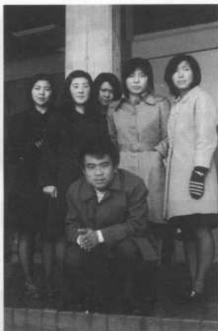
S48年、岩手山青年の家にて(2年生研修)

常日頃、講話の中で「思い出は一生の宝です。それは人生を豊かにし、苦しいときには勇気を与えてくれます」と生徒に話していた。種市高校同窓生の皆さん、素敵な思い出を本当にありがとうございます。