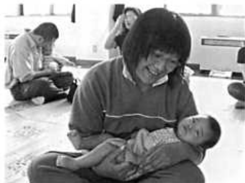
高校時代保育実習にて

て、この仕事に就きたいと思ったのは、父のおかげです。父も潜水士なのですが、私は恥ずかしながら中学校に入るまで父が潜水士という事をまったく知りませんでした。知ろうとさえしませんでした。それは、父が単身赴任で、めったに家には居なかったのも理由の一つなのですが、初め