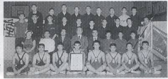
種市高校初優勝（上段右から3番目）

また、水中土木科の授業では、初めて種市の沖合で潜り、「ほや」や「ウニ」がたくさんいたことにも感動しました。