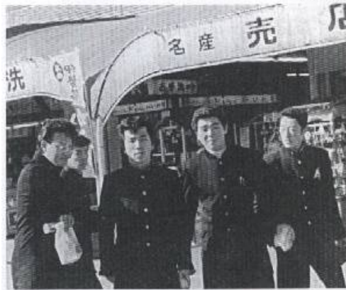
修学旅行の写真 右から3番目