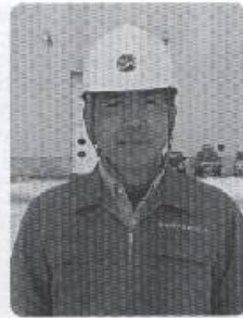
むつ研究所 1月10日撮影

私が種市高校に在学した期間は、昭和55年からの3年間で、私は「海」が好きで、潜る仕事が好きで種市高校の水土木科に入学しました。当時、男子の制服は、ぶかぶかのズボンに丈の短い学生服が流行し、生徒指導の先生に叱られながら勉強や部活に励んでいました。そのころの生徒数は、今と違い1学年で5クラス（普通科4クラス、