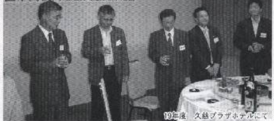
19年度 久慈プラザホテルにて