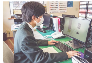
リアス観光株式会社