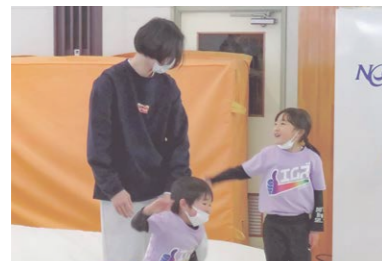
エムズスポーツクラブ

1学年の春休み、町内企業を中心としたインターンシップに挑戦。インターン先の選定から企業へのお願いまで、生徒自らが実行しました。