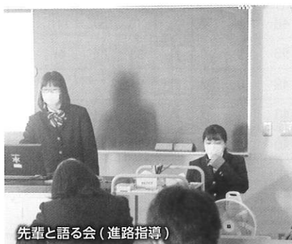
先輩と語る会(進路指導)

業選考開始日が9月16日から1か月遅れの10月16日に変更になりました。求人票の受付は、例年通り7月1日から始まりましたが、ホテルや旅館関係の求人数の減少が顕著に現れました。幸い本校生徒が希望する企業に関しては、求人票を出していただくことができたため、ほとんど影響を受けずに就職活動に取り組むことができました。就職を希望する企業を探し、夏休み中に企業見学を行って、受験する企業を決定しました。自分に合った職業や職場を選ぶために、一人で3社の見学をした生徒もいました。最終的に、岩手町を含む盛岡管内9名、県内1名、県外1名、合計11名の就職内定をいただきました。