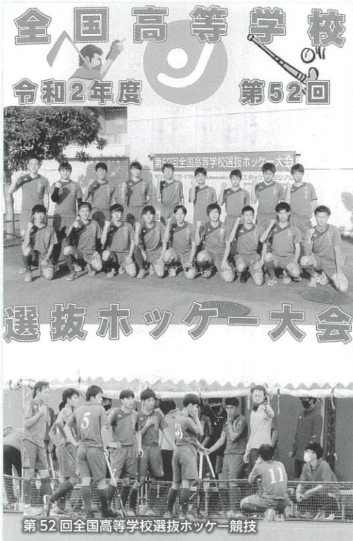
全国高等学校 令和2年度 第52回