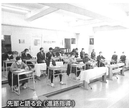
先輩と語る会(進路指導)