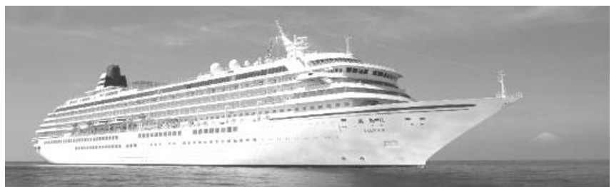
日本郵船の客船 飛鳥 II