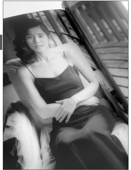
石田ゆり子写真集 (94年) より