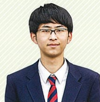
令和3年度 生徒会長