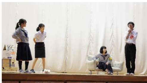
☆志高祭の舞台「令和殿の4人」

8月に行われた演劇研究発表会への参加は、演劇の楽しさを再認識する機会となり良い刺激になりました。他校の発表からは何度も心を揺さぶられ、また、多くの学びがあり、何度も「自分たちもこんな劇をつくりたい」と思われました。今回、県大会へ参加するにあたって、仲間と共に自分たちの劇と再び向き合い、よりよいものにしていきたいと思います。自分たちで「良い劇ができた」と思える劇がつけられるよう、日々活動していきます。