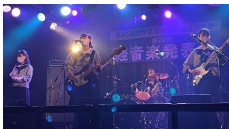
☆演奏するWABのメンバー

今回の発表会では、入部してからこれまでの練習の成果を発揮できたと感じています。コロナ禍で部活動に制限がある中での練習ではありましたが、本番では普段のライブとは違った緊張感をもって演奏することができました。また、この発表会を通して、部内ライブや練習への取り組み方も見直せる部分が見つかったと思います。これからも、各バンドの色が出るような練習ができれば良いなと思います。