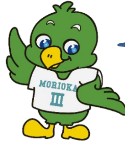
三高マスコット「トナンくん」