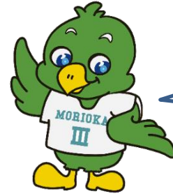
三高マスコット「トナンくん」