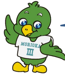
三高マスコット「トナンくん」