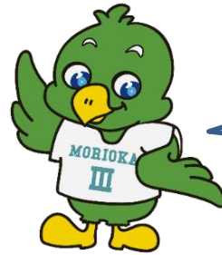
三高マスコット「トナンくん」