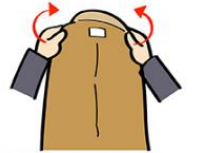
2. 袖はそのまま身頃部分のみ裏返す