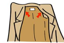
1. コートの両肩に内側から手を入れる

これはあくまでビジネスにおけるマナーなので、全てのことが高校生の君たちに当てはまるわけではありません。でも本来、公共施設である学校に入るときは、昇降口でコートを脱がなければならないことを知ってほしいのです。普段、校外の図書館や病院などの公共の施設に入るとき、君たちはどうしているのでしょうか？雨や雪でダラダラとしたコートで施設内を歩いてはいませんか？でも大丈夫！この記事を読んだ君たちなら、外部から花粉や埃、雪などを施設内に持ち込まないように、気配りができるようになっているはず！今日から実践！！Plus Ultra！！