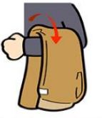
4. 上下を二つに折る