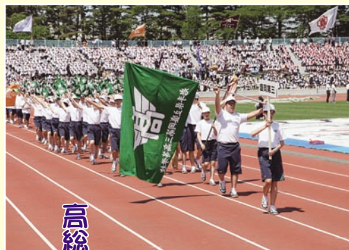
高総体開会式 (6月22日)