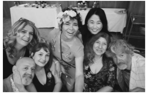
イスタンブール市内のホテルで友人との会合

同世代なら誰しもが知っている庄野真代のヒット曲『飛んでイスタンブール』。当時“ザ・ベストテン（木曜9時に放映されていた歌番組）”で、庄野真代がイスタンブールの旧市街と新市街を結ぶガラタ橋上から生中継で歌っていたのを覚えている。それから約40年過ぎた今、イスタンブールに住み、そのガラタ橋は自宅から歩いて行ける距離だ。この街が好きで、飛んで来てしまったのは20歳台後半。7年間滞在し、帰国した。帰国後はトルコ大使館で働いた。英語を教えたいという夢を叶える為、アメリカの大学の日本校に通い、TESOL（英語を母国語としない人に英語を教える資格）を取得したのは42歳。千葉県船橋市の中学校で、講師として教科書のないリスニング・スピーキング中心の授業を行った。気が付くと、帰国してから12年の歳月が過ぎていた。