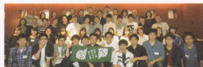
6月18日 新人歓迎会。 総勢50名。 ホテルグランドパレス1Fカトリア。