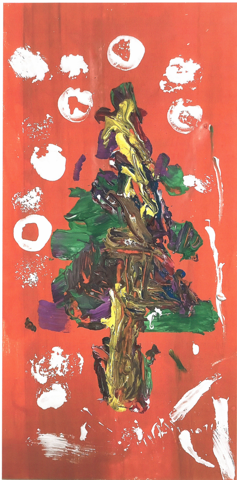
「わたしのクリスマス」