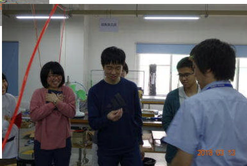
深圳博物館の前で