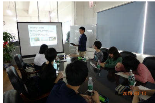
(於：第一電材 岩谷堂にも支店あり)