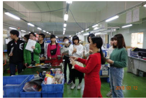
(於：東京彫刻工業株式会社)