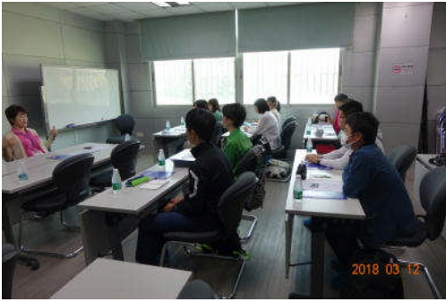
(於：テクノセンター)