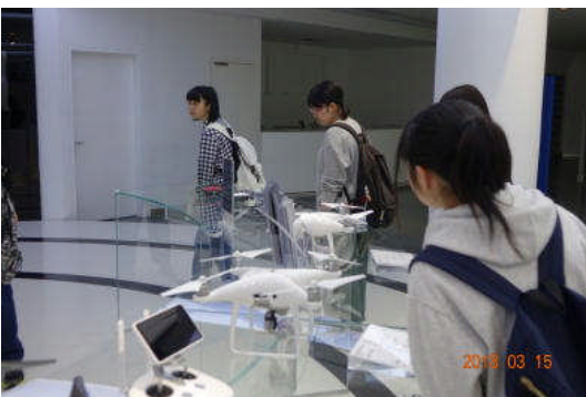
(於：D J I)