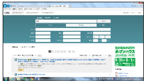
図1: CiNii の検索ページ

そのようなときは、右の表(表1)を参考にしてみてください。この表は皆さんの持っている『理科課題研究ガイドブック』の5ページの表を元に作成したものです。『理科課題研究ガイドブック』は非常に優れたテキストです。何か分からないことや困ったことがあったときには、ぜひ開いて参考にしてください。