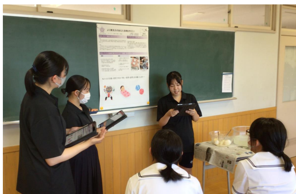
ポスターを使って、ゼミ活動の紹介をしました！

ゼミ活動では、10月に中間報告発表があります。生徒たちはその発表に向けて引き続き活動していきます！