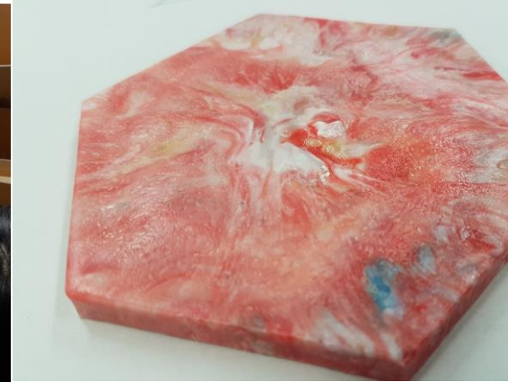
ペットボトルのフタから作製したコースターの試作品