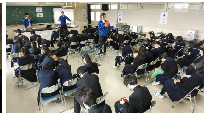
「鵜飼」？ いえいえ、地上基地からの受信です。