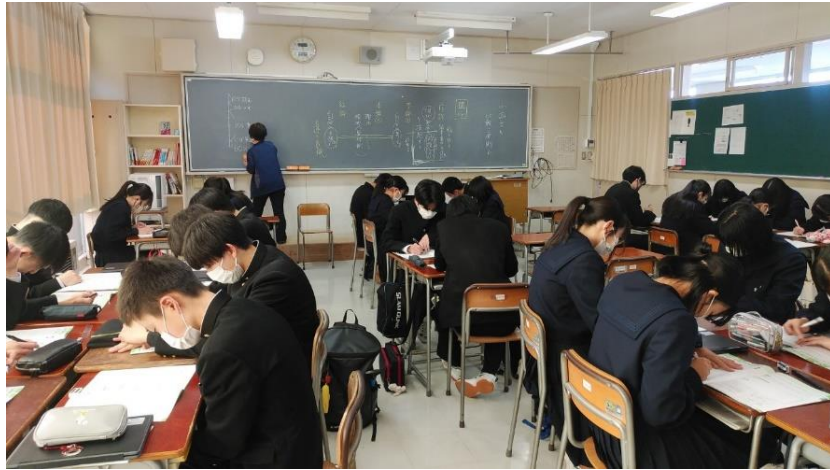
「非核三原則」も「比較三原則」も私たちの「未来」を救うのだ。