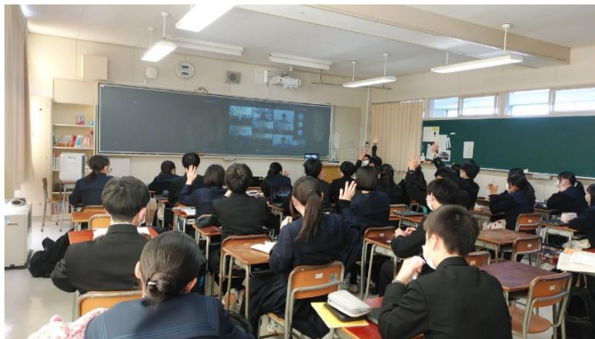
衛星の安全性はどのように保たれているのかなあ

また、スペース BD 西先生とスタッフの方々のご協力をいただき、グループ単位で人工衛星に関わる課題解決を行うワークショップ「人間衛星」を実施しました。知的好奇心を大いに刺激する講演と自らを衛星の様々な装置に置き換えての実践に、頭脳をフル回転させての講座となりました。