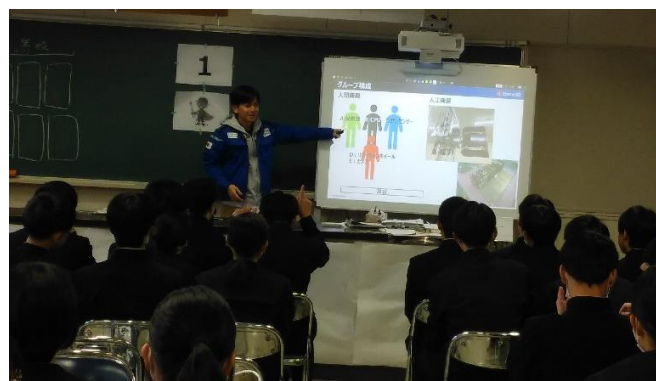
衛星受信の仕組みを人に置き換えて考えると・・・