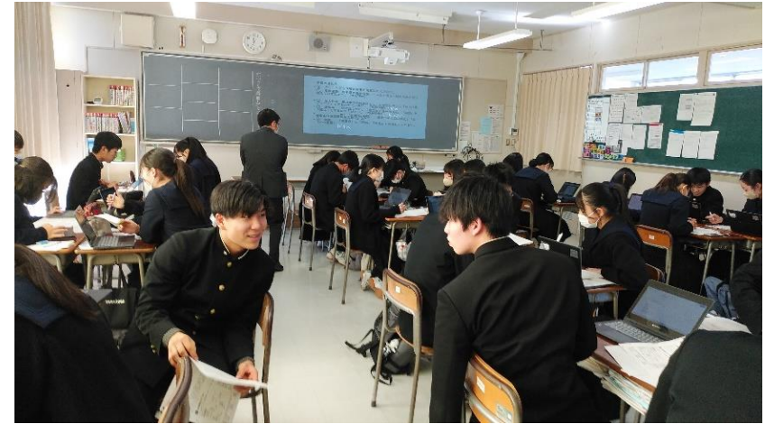
もうすぐみんな有権者。地域の課題を調べよう。