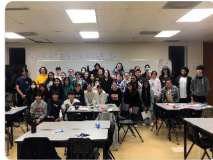
日本文化紹介集合写真⑤