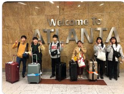
アトランタ空港にて