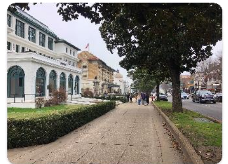
ホットスプリングス市内③