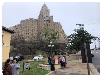
ホットスプリングス市内②