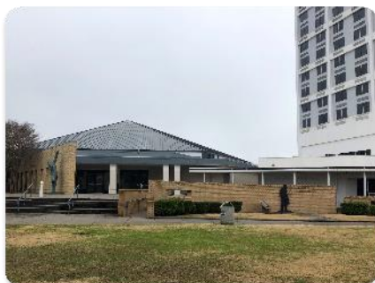
市内にある宮沢賢治コーナー①