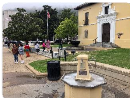
ホットスプリングス市内①