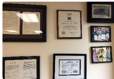
姉妹都市姉妹校締結コーナー①