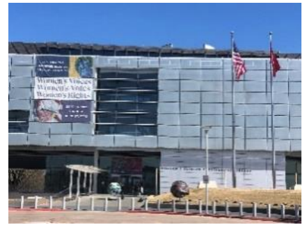
リトルロック市 ビルクリントンセンター見学