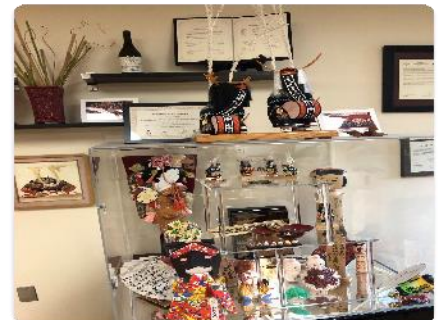
姉妹都市姉妹校締結コーナー②