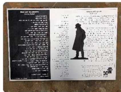
市内にある宮沢賢治コーナー②