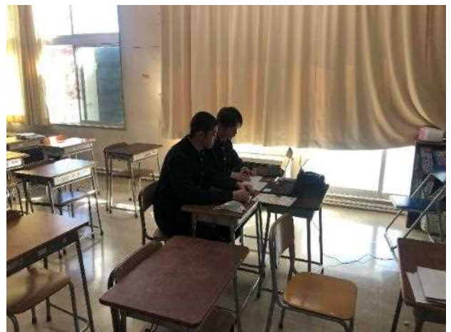
ZOOM を通して、インタビューしたグループもありました。