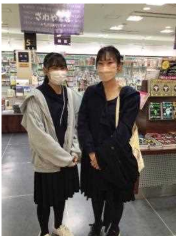
盛岡駅「さわや書店」様にて、参考文献を探してきました。