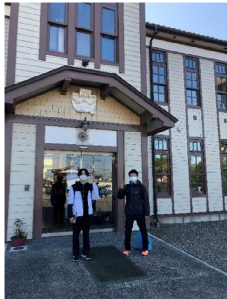
「奥州宇宙遊学館」様にて、宇宙での生活と宇宙食についてインタビューしてきました。