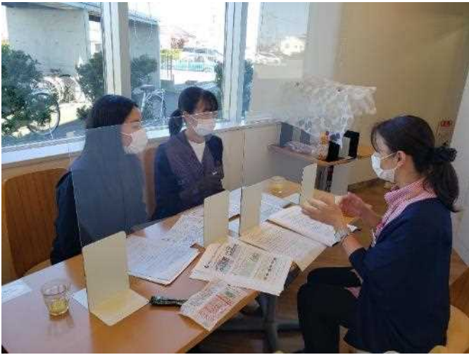
「岩手県予防医学協会」様にて、岩手の食と生活習慣病との関係についてインタビューしてきました。