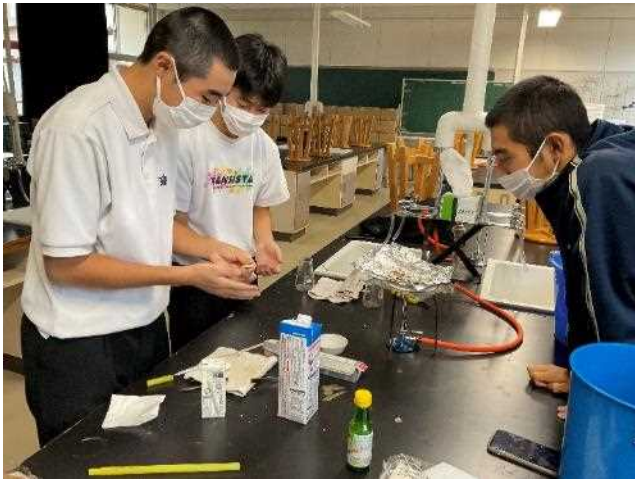
校内物理室では実験が行われました。