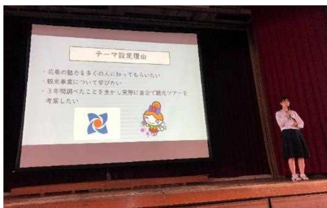
2位 佐藤和奏 花巻の地域活性化