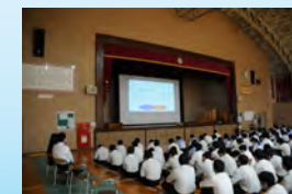
講話を聞く生徒たち