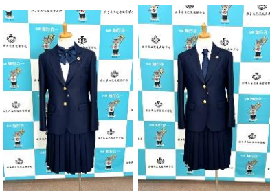
女子はリボンでもネクタイでも可

再来年度の1年生から制服を変更することにいたしました。現在、男子は紺の詰め襟、女子はブレザーでしたが、生地もスタイルも男女同じ物でブレザータイプとし、女子もスラックスがはけるようにします。現在、生徒会を中心にネクタイ、リボンの選定をしているところです。今の生徒は着ることが出来ませんが、女子のスラックスを希望する人には対応したいと思っています。また、来年度は夏の軽装として紺のポロシャツを準備しているところです。