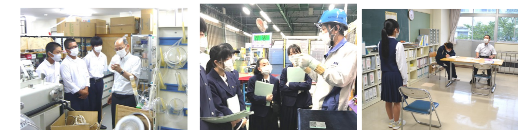
1学年 上級学校見学会