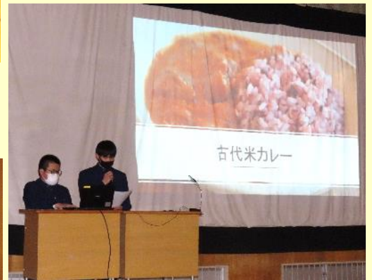
👉 【農業・畜産業・林業】グループは、第6次産業を実践している「古代米おりざ」の新メニューづくりに挑戦しました。