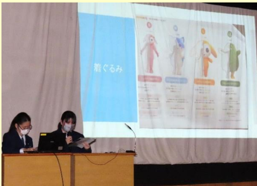
👉 【観光・名所・名産B】グループは、「花と泉の公園」を盛り上げるためのキャラクターの着ぐるみのデザインなどについて発表しました。