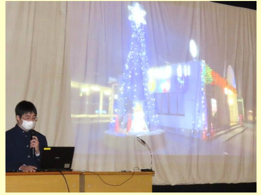
👉 【地域おこし・暮らし】グループは、花泉駅の冬のイルミネーションや環境整備活動、壁画の計画などを発表しました。