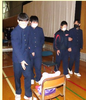
👉 【福祉B(介護)】グループは、白内障体験用の自作のゴーグルを使って、他の生徒に体験してもらいました。。